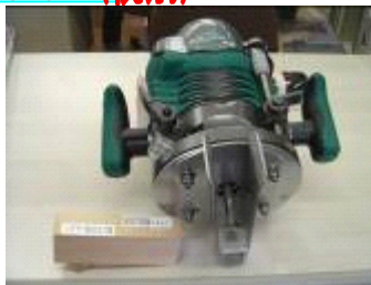
(ローター取り付け加工例)